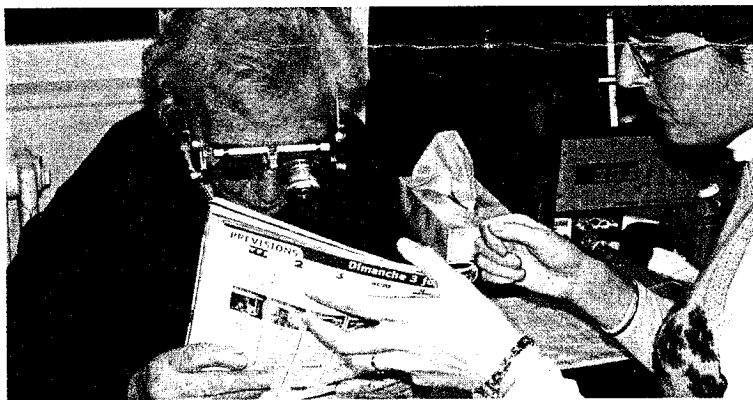
Scène de l'opération Basse Vision en Pays de Loire

ce domaine, se sont mobilisés et réunis autour d'un projet à l'échelle régionale. Une association a été créée et un financement alloué par la CPAM. A partir de deux centres "opérationnels" (Le Mans et Nantes) couvrant les cinq départements, les malvoyants sont orientés vers les professionnels les plus proches. Ils sont plus d'une centaine pour l'heure, s'engageant à respecter une charte. Ils attendent 150 à 200 malvoyants en 2003 et prévoient de doubler ce chiffre en 2006. Pour plus de renseignements : www.abcbassevision.com . ●